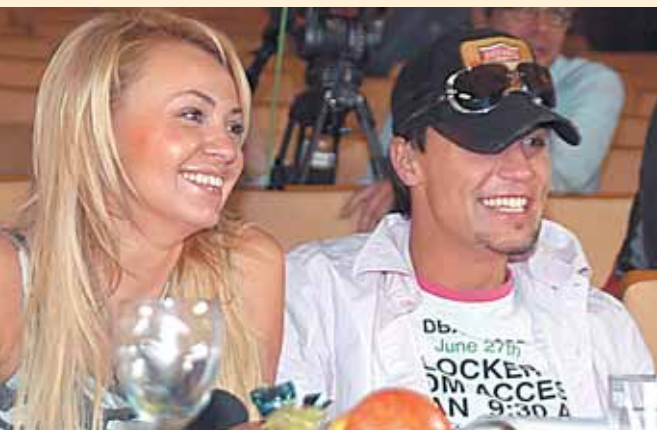
■ Председатель жюри Яна Рудковская и Дима Билан: «Посмотрим, как вы запоёте к Новому году!»

Яна Чурикова: «Шестую «Фабрику» сдала, седьмую принимаю!»