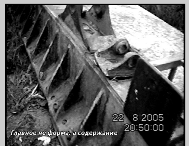
Главное не форма, а содержание