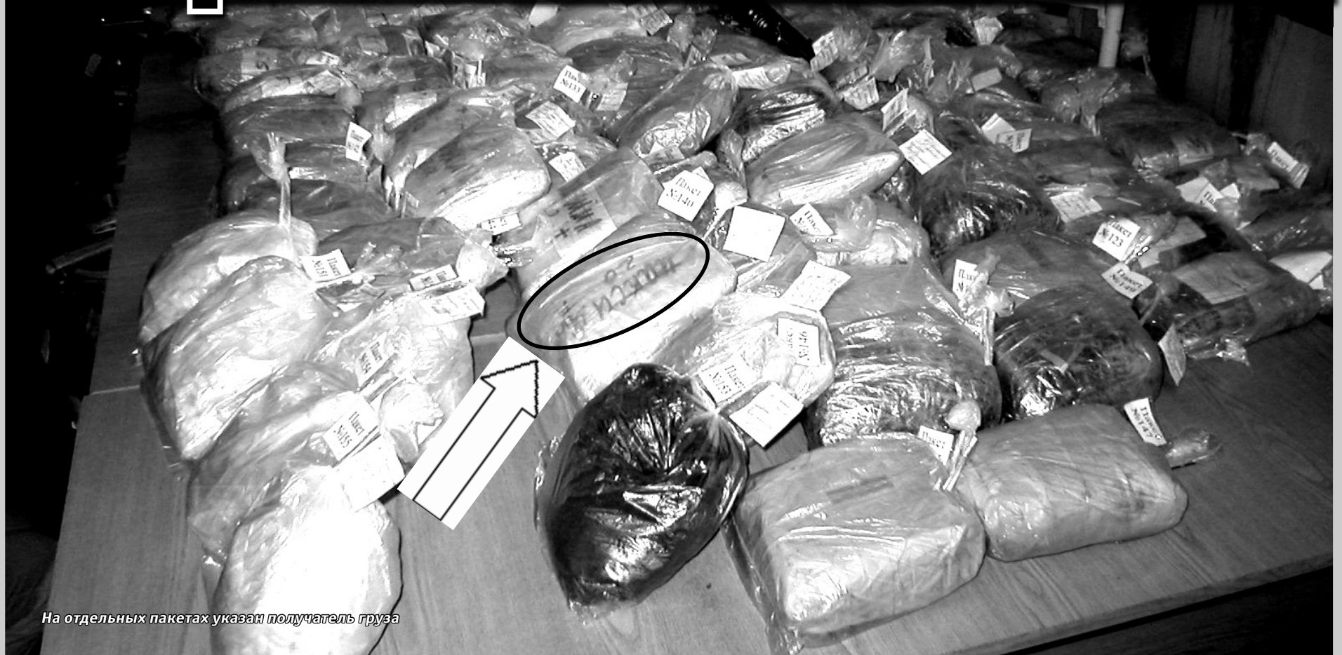
На отдельных пакетах указан получатель груза