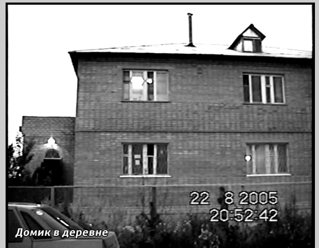
Домик в деревне

В уголовных делах такого порядка очень важны вещественные доказательства. На этот раз их у следствия предостаточно, включая документальную видеосъемку. Адвокатам защиты трудно надеяться на успех.