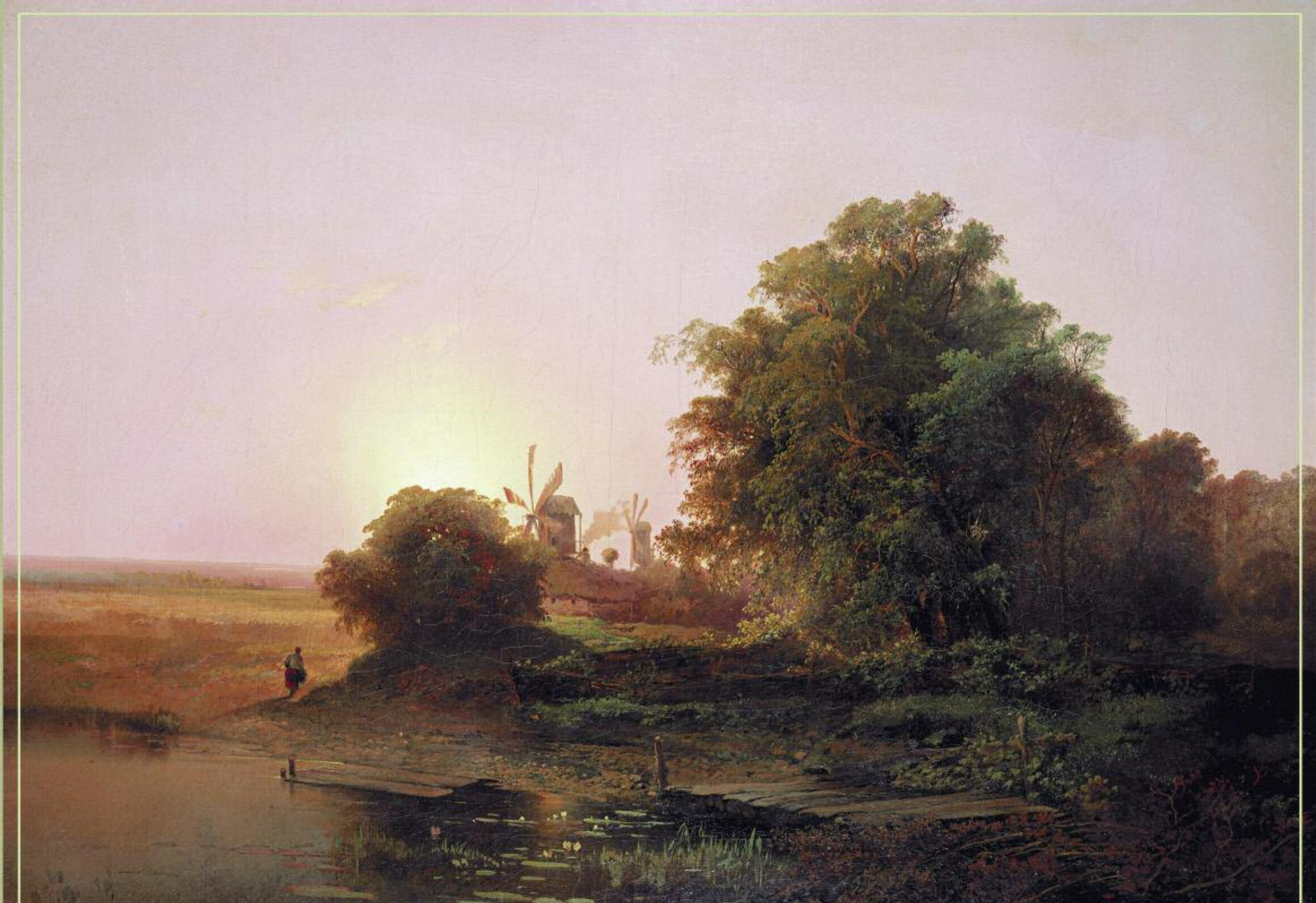
САВРАСОВ Алексей Кондратьевич, 1830-1897 Летний пейзаж с мельницами. 1859 Холст, масло, 58 × 80