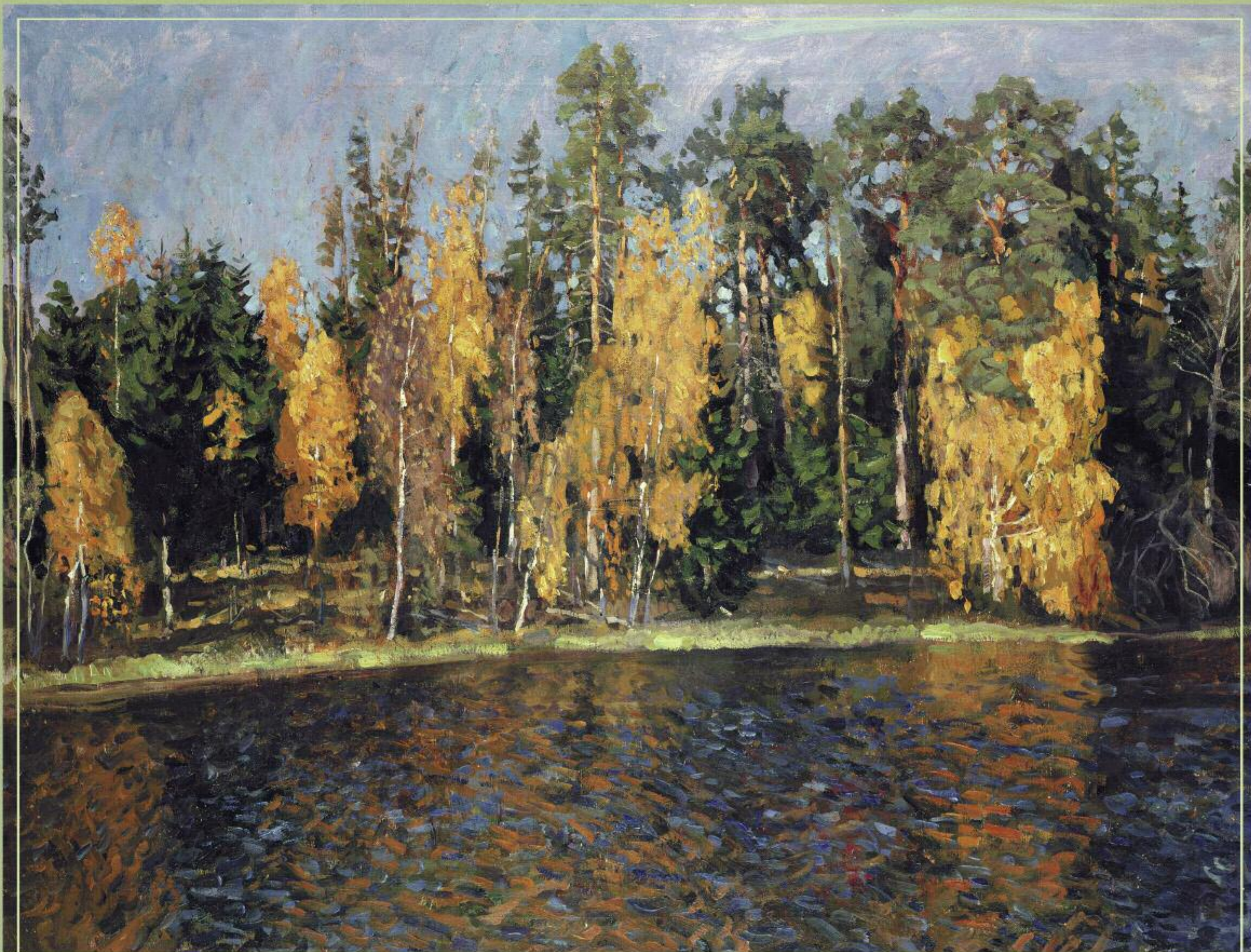
ЖУКОВСКИЙ Станислав Юлианович, 1873-1944 Лесное озеро. Золотая осень. 1912 Эскиз для одноименной картины (1912, Харьковский художественный музей) Холст, масло, 71 x 90