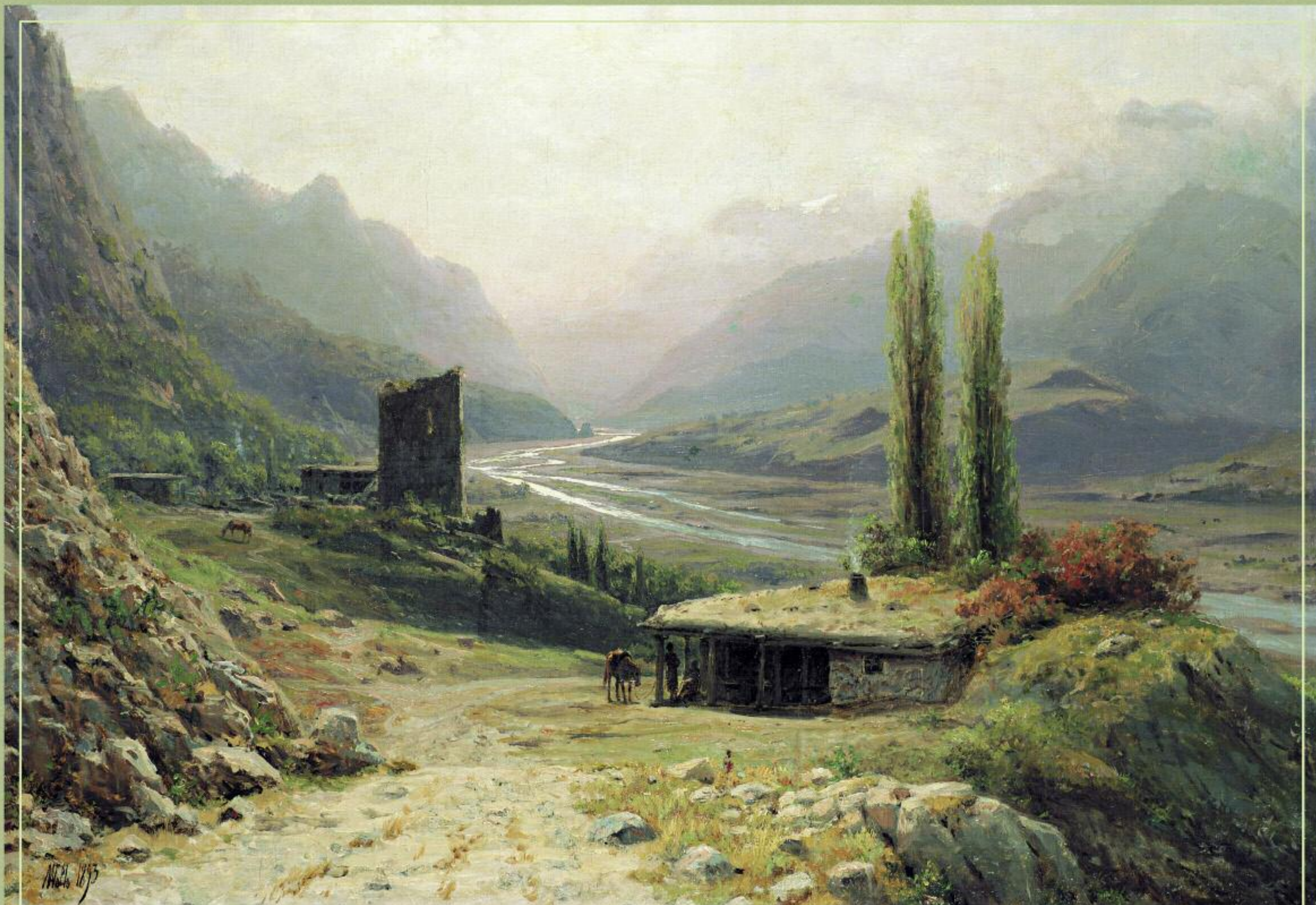
ЛАГОРИО Лев Феликсович. 1827-1905 Кавказское ущелье. 1893 Холст, масло, 52,5 x 75,5