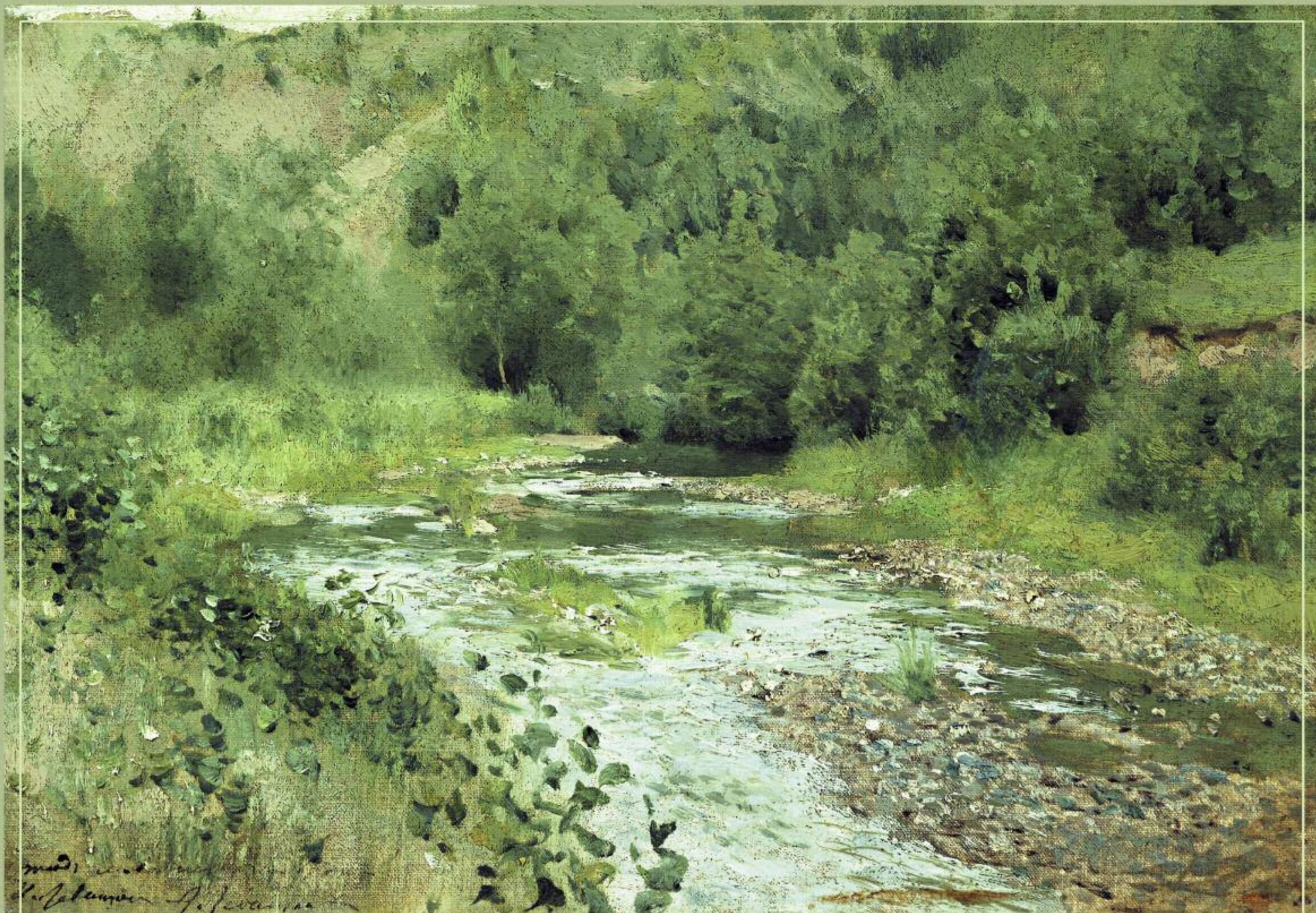
ЛЕВИТАН Исаак Ильич, 1860-1900 Речка. Конец 1880-х Эскиз для картины "Осень, Мельница, Плес" (1888, ГТГ) Холст на картоне, масло, 22,6 x 32,4