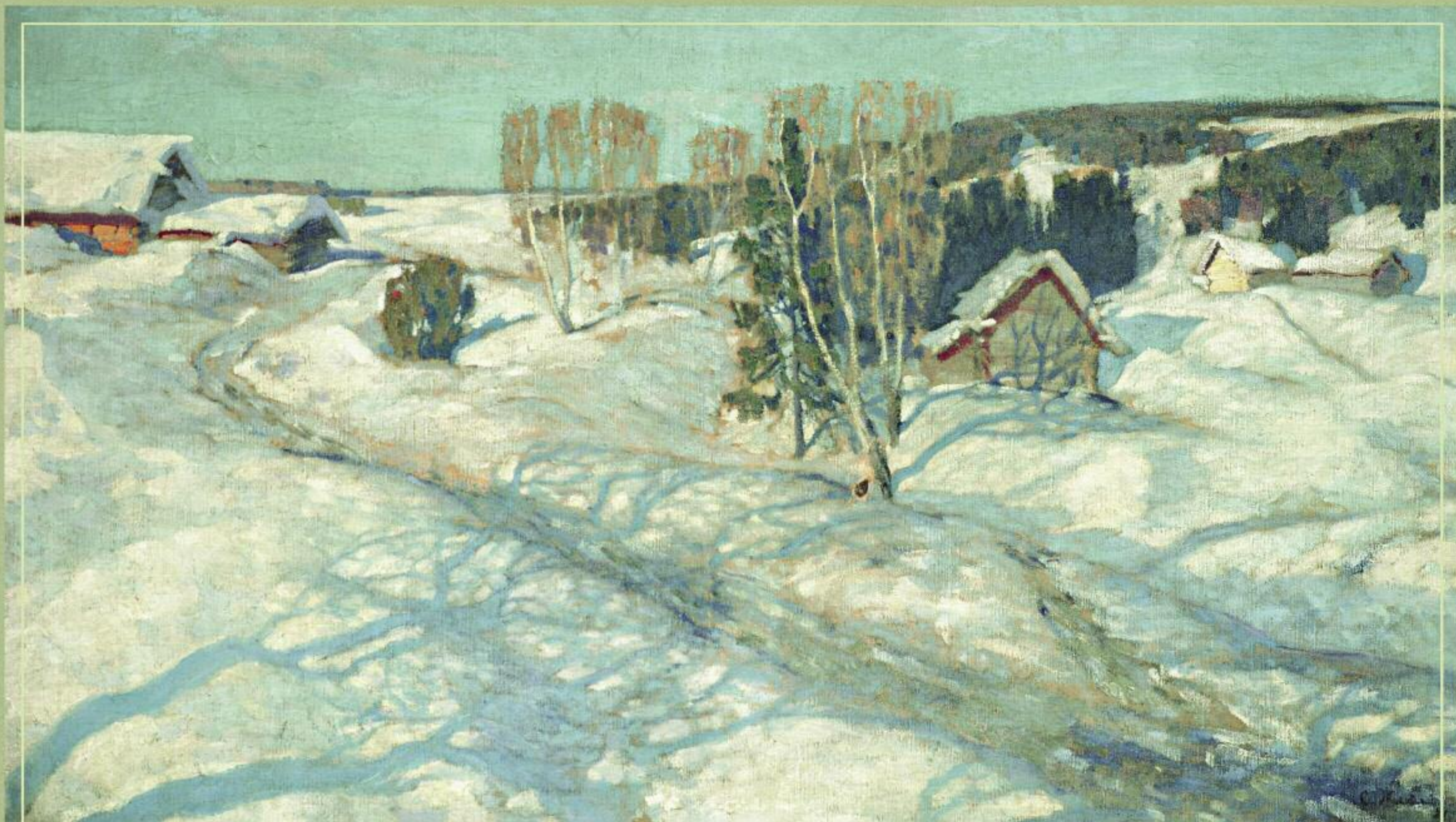
ЖУКОВСКИЙ Станислав Юлианович, 1873-1944 Весна. Синий снег. 1899 Холст, масло, 80 x 142