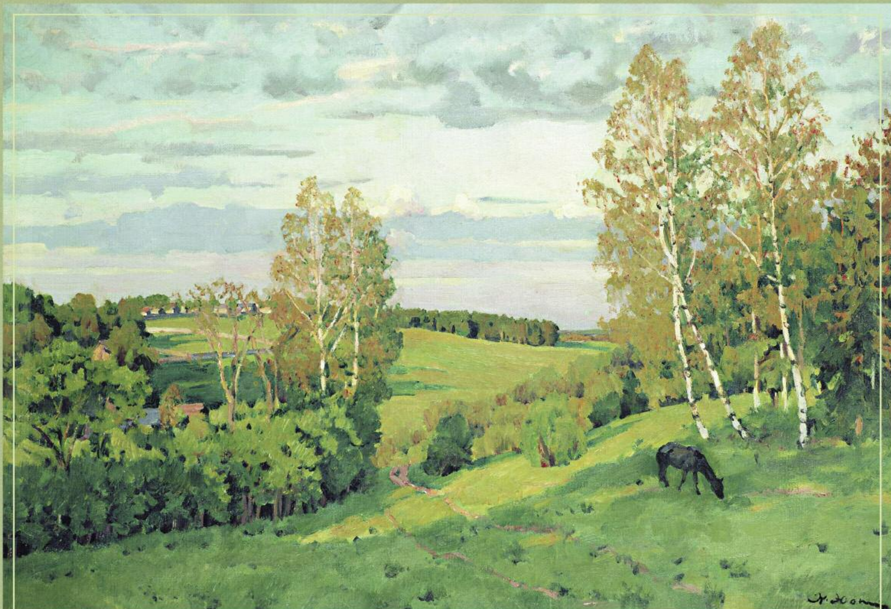
ЮОН Константин Федорович, 1875-1958 Майский вечер, 1900-е Холст, масло, 62,5 x 89,2