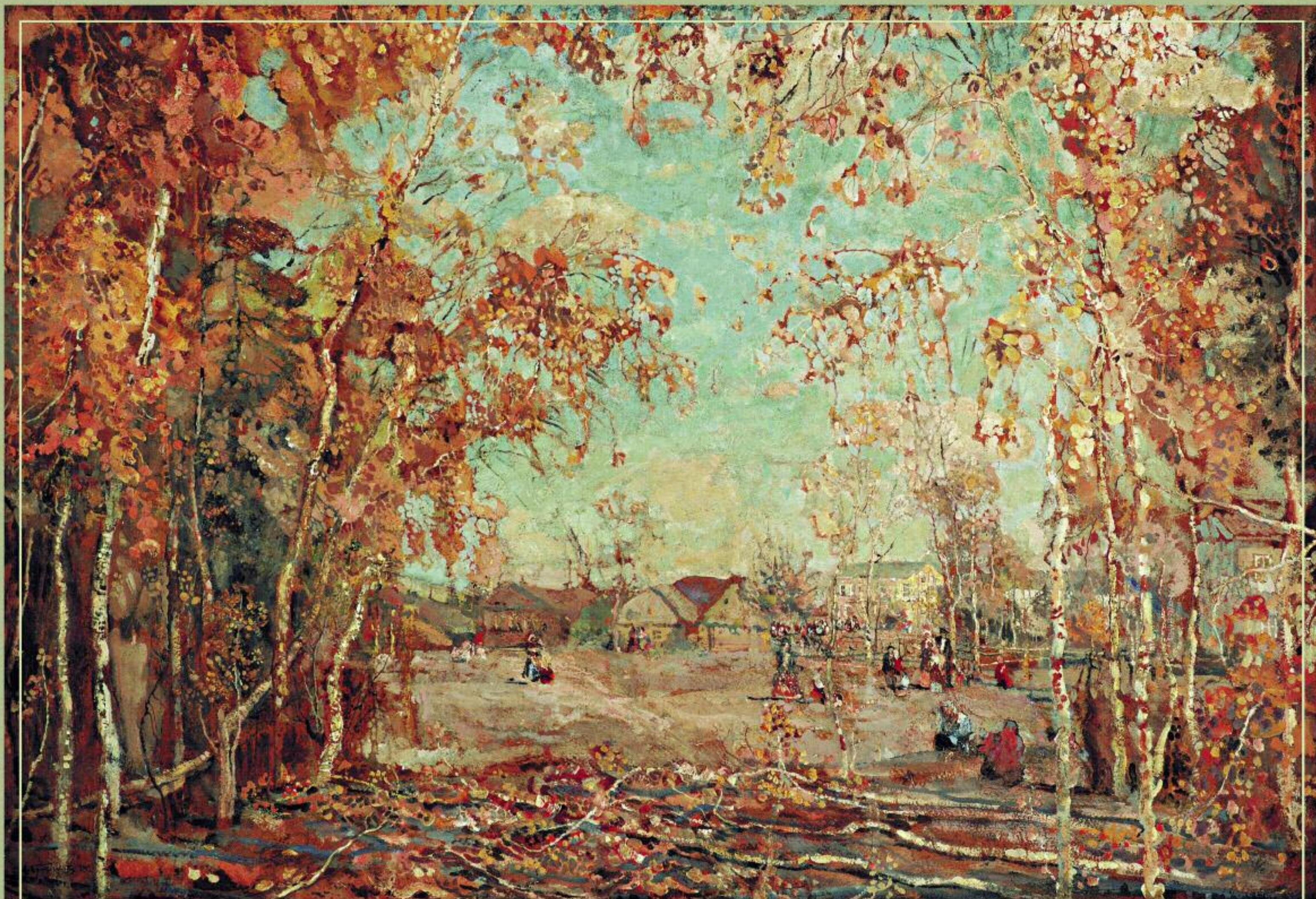
БРОДСКИЙ Исак Израильевич, 1884-1939 Осень. 1912 Фанера, масло, 69,5 x 101