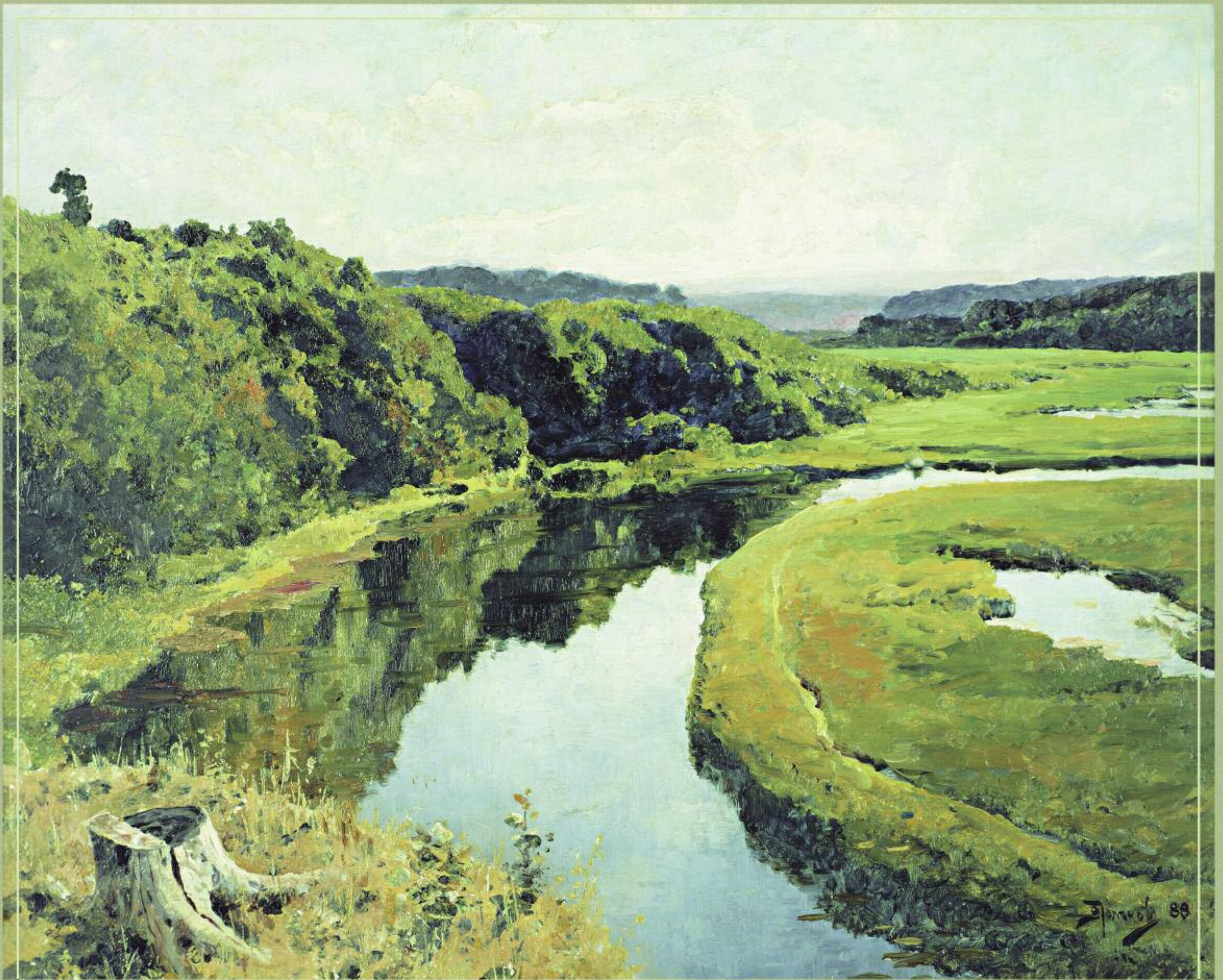
ПОЛЕНОВ Василий Дмитриевич, 1844-1927 Пейзаж. Жуковка. 1888 Дерево, масло, 37 x 46