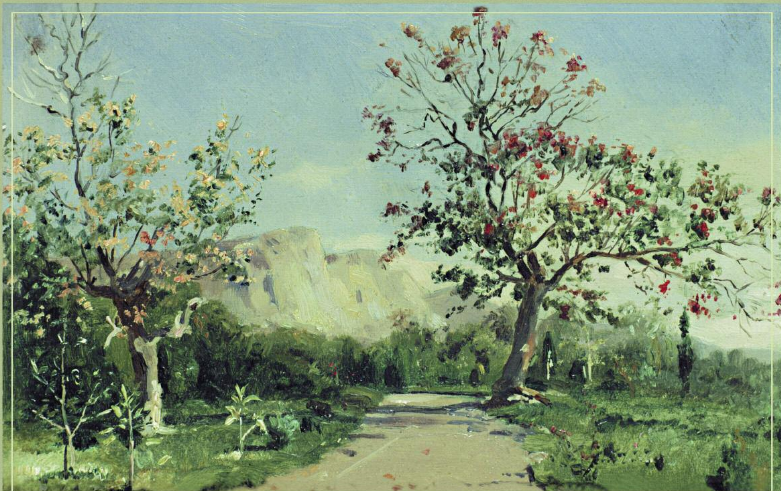
МАКОВСКИЙ Владимир Егорович, 1846-1920 Цветущий миндаль. Севастополь. Эскиз Дерево, масло, 13,5 × 20,5