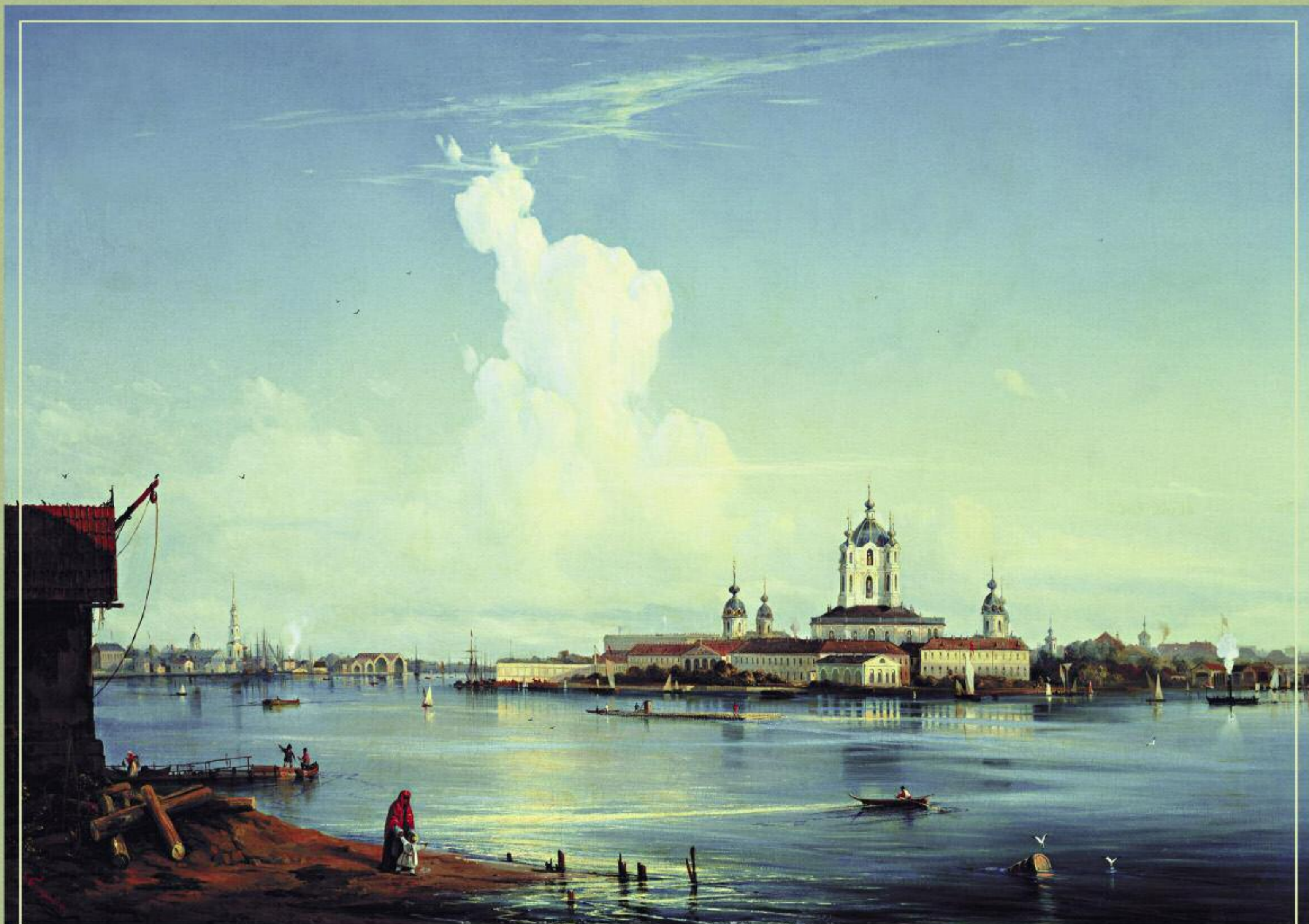
БОГОЛУБОВ Алексей Петрович, 1824-1896 Вид на Смольный монастырь со стороны Большой Охты. Начало 1850-х Холст, масло, 118 x 168