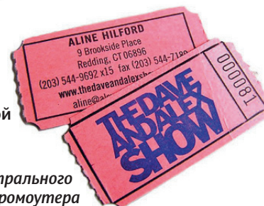
визитка театрального промоутера

PS: Кстати, все сказанное о визитках целиком и полностью применимо к любой рекламно-информационной и имиджевой полиграфии.