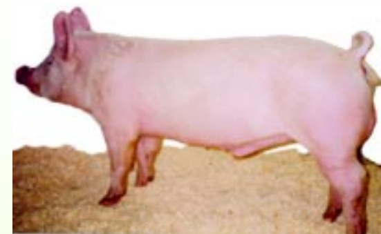
АЛЬБА терминальный хряк: