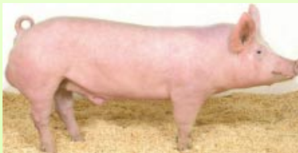
КРУПНАЯ БЕЛАЯ прародительское стадо GP: