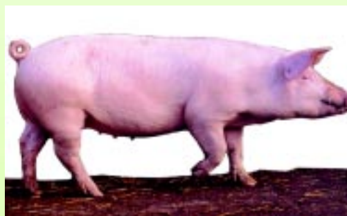
ГИБРИДНЫЕ МАТКИ родительского стада P: