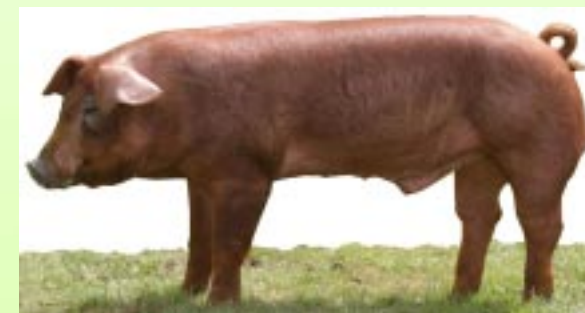
ДЮРОК терминальный хряк: