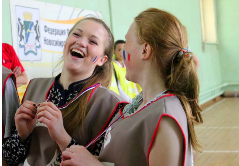
Участники: Бердский политехнический техникум

Тогда же ребята познакомились с еще одним, неизвестным для них видом спорта – фризби, игрой с летающим диском. Игра очень динамична и зрелищна, требует хорошей реакции, техники броска, скорости и выносливости.